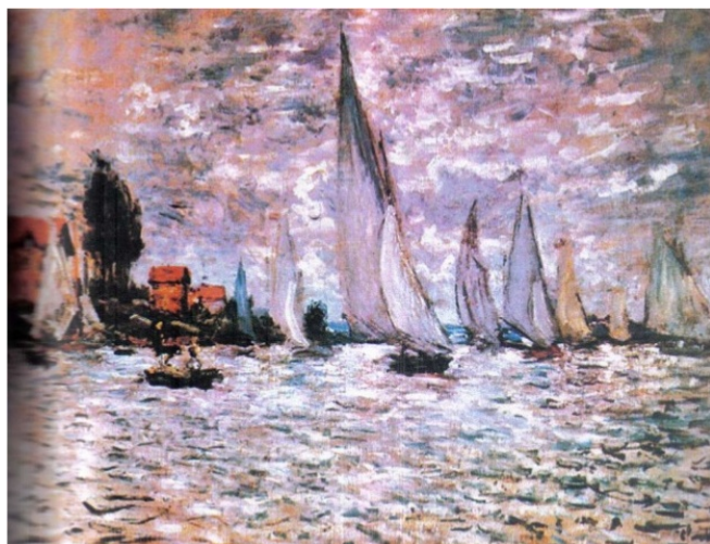
Regata em Argenteuil sob céu escuro. Monet. 1874.

A arte impressionista foi criada no final do século 19 na Europa. Esse movimento surge com uma exposição realizada em Paris, em 1874. Os artistas impressionistas buscavam representar em suas obras os efeitos que a luz do sol produz na paisagem e as transformações da luz e da sombra em diferentes horários do dia. Era um estilo artístico mais prático do que teórico, já que os impressionistas não criaram um sistema padronizado, porém compartilhavam técnicas e procedimentos de criação semelhantes.