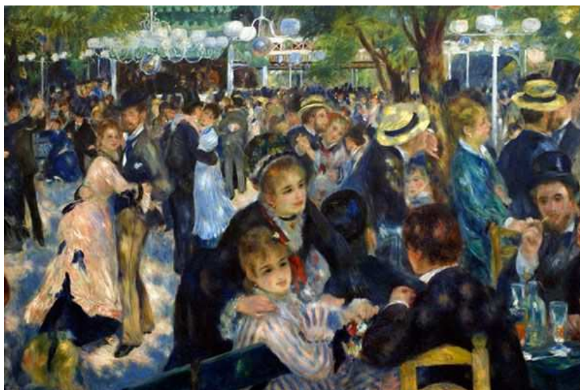
Baile de Moulin de la Galette. Renoir. 1876.

No início, o público não recebeu bem as obras impressionistas e só anos mais tarde elas passaram a ser valorizadas. O Impressionismo marca uma série de transformações que ocorrem na arte europeia, que mais vão dar origem às vanguardas do século 20. Alguns dos principais artistas do Impressionismo foram Monet, Renoir e Cézanne. Os impressionistas costumavam pintar ao ar livre para registrar as mudanças nas cores da natureza e dos objetos, devido à luz do sol. Eram usadas mais cores puras do que misturas de tons.