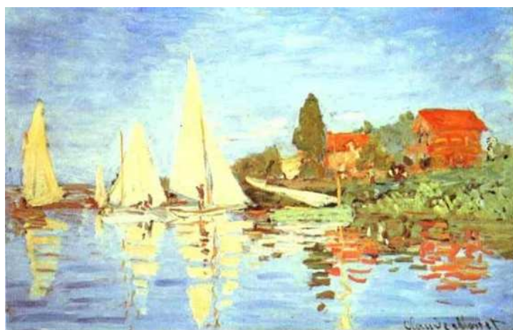
Regata em Argenteuil. Monet. 1872.